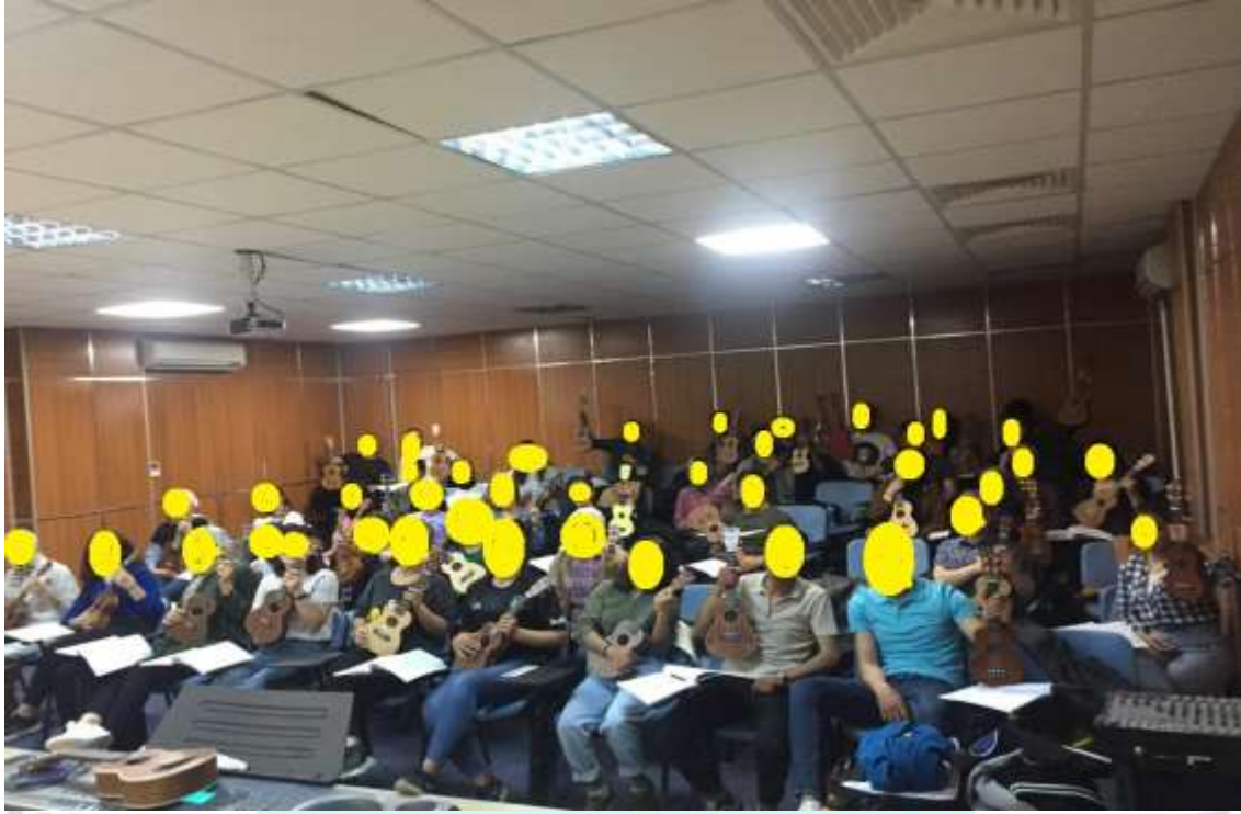
Görsel 1. Okul Öncesi Öğretmenliği Erken Çocukluk Müzik Eğitimi Çalgı (Ukulele) Dersi

Müzik eğitiminde kolay ve rahat çalınabilen çalgılardan biri olan “Ukulele” son zamanlarda oldukça yaygın ve popüler bir çalgı olduğu sosyal medyada görülebilmektedir. Özellikle eşlik çalgısı olarak ses ile uyumlu olan bu çalgı okul öncesi öğretmenliğinde kullanılabilir ve öğrenilebilir.