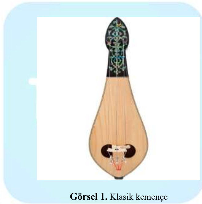
Görsel 1. Klasik kemençe

Türk Müziğinin en önemli çalgıları arasında yer alan ve insan sesine en yakın sazlarından biri olan klasik kemençe, çok eski zamanlardan beri kullanılarak günümüze kadar ulaşmış olup çalım tekniği ve tavır olarak Karadeniz yöresine ait bildiğimiz kemençeden tamamen farklıdır. Klasik kemençe üç veya dört telli olup tutuş bakımından diz üzerinde veya dizlerin arasına konularak tırnakların tele temas ettirilmesiyle çalınmaktadır. Türk Musikisinde armûdi kemençe, tırnak kemençe, fasıl kemençesi ve İstanbul kemençesi gibi isimlerde kullanılmaktadır. Bu çalgı özellikle sanat müziği başta olmak üzere tasavvuf müziği ve halk müziğinde de icra edilmektedir. Kemençe icra eden kişiye kemençevî denilmektedir.