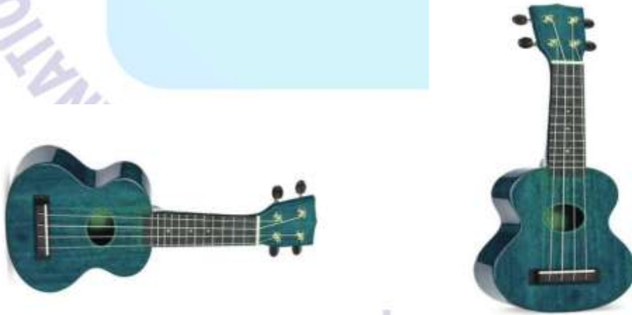
Görsel 2. Ukulele

Müzik eğitiminde kolay ve rahat çalınabilen çalgılardan biri olan “Ukulele” son zamanlarda oldukça yaygın ve popüler bir çalgı olduğu sosyal medyada görülebilmektedir. Özellikle eşlik çalgısı olarak ses ile uyumlu olan bu çalgı okul öncesi öğretmenliğinde kullanılabilir ve öğrenilebilir.