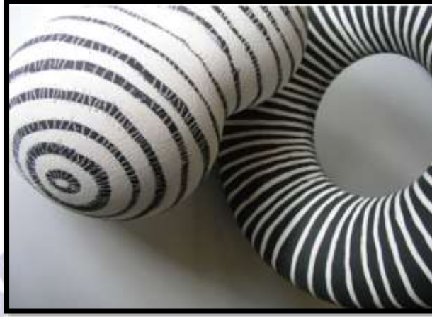
Görsel 1. Fran Maguire, “ Morphing ”