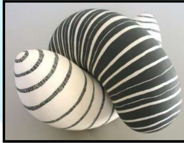
Görsel 2. Fran Maguire, “ Growth 3 ”

Sanatçı Görsel 3’de görülen eserinde yine hem form da, hem de yüzeyde zıtlık ilkesini kullanmıştır. Maguire, formda boşluk-doluluk unsurları ile simetri-asimetri denge unsurlarını birlikte çalıştırılarak formlar arasında zıtlık yaratmaya çalıştığını belirtmektedir. Çizgi ögesi ile bütünsellik ve armoni yakalamayı hedefleyen sanatçı, yüzeylerde yine siyah ve beyazın yarattığı dinamik etki ile izleyicide ritim, hareketlilik ve karmaşa duygularını titreştirmeye çalıştığını dile getirmektedir.